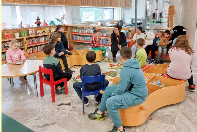
Noč knjige na Osnovni šoli Kozara v Novi Gorici.

Vsako leto 23. aprila obeležujemo svetovni dan knjige . Ta dan po Sloveniji in po svetu potekajo številni dogodki, naša Šola človekovih pravic pa že tradicionalno sodeluje na Noči knjige . Izberemo knjige, pripravimo spremljevalna-izobraževalna gradiva in povabimo slovenske šole k sodelovanju. Veseli smo, da nas je vsako leto več in da slovenski učitelj_ice prepoznajo pomembno vlogo branja in knjig v izobraževalnem procesu. Vsaki šoli, ki je del dogodka, podarimo knjigo. V 2025 je z nami sodelovalo kar 100 šol. Hvala vsem.