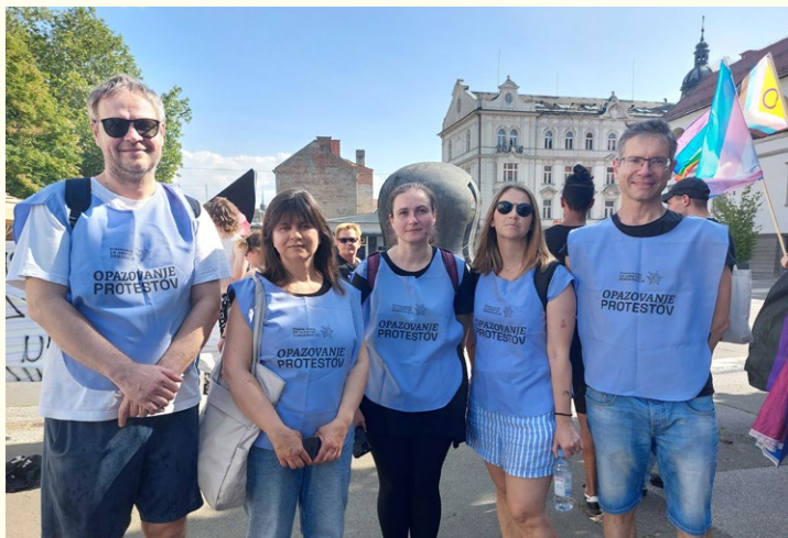
Monitoring parade ponosa v Mariboru.

Pravica do protesta , ki se uveljavlja skozi pravico do mirnega zbiranja in svobode izražanja, je eden od temeljev delujoče demokratične družbe. To je tudi glavni razlog za izvajanje monitoringa protestov, s čimer skozi objektivno in nepristransko opazovanje, dokumentiranje in pripravo poročil prispevamo k zagotavljanju pravice do protesta.