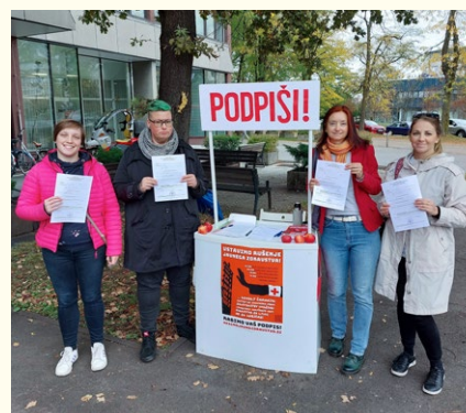
Del ekipe slovenske Amnesty ob oddaji podpisov podpore interventnemu zakonu za zdravstvo.

Glas ljudstva povezuje več kot 100 organizacij civilne družbe, med njimi je tudi slovenska Amnesty. Povezali smo se pred zadnjimi parlamentarnimi volitvami, ko smo stranke pozvali k zavezam glede različnih pomembnih tem, vključno na področju človekovih pravic. Stranke, ki so po volitvah sestavile vlado, so se skupno zavezale k uresničitvi 122 zahtev , kar Glas ljudstva redno spremlja. Poleg tega monitoringa zahtev pa izvaja tudi akcije za informiranje, opolnomočenje in mobilizacijo ljudi. Ena izmed pomembnejših kampanj v letu 2023 je bila kampanja za zdravstvo , v okviru katere so potekale številne