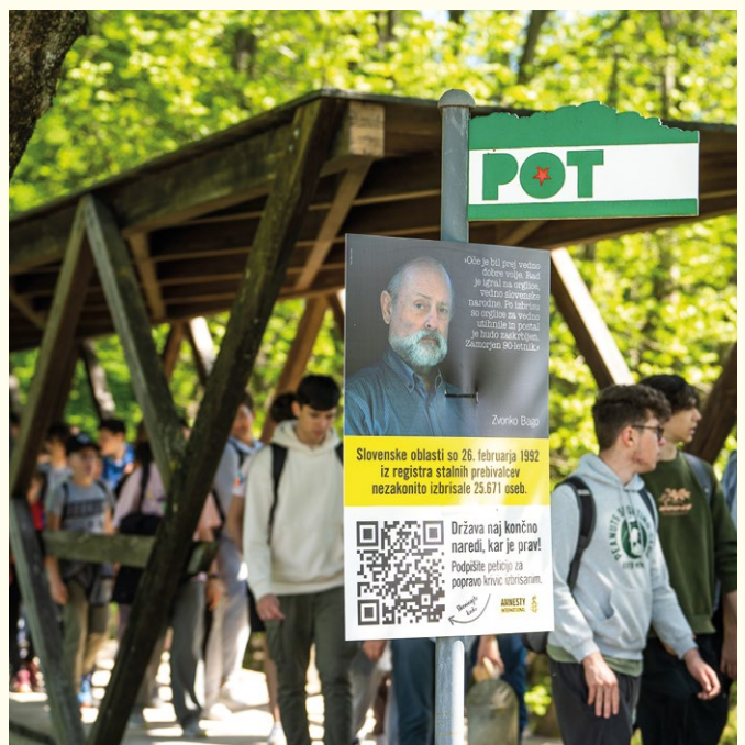
Pot ob žici 2023.

Na prireditvi Pot ob žici, ki je v Ljubljani potekala med 4. in 6. majem, je vnovič sodelovala tudi Amnesty International Slovenije. Naše ekipe so pohodnike_ce v soboto pričakale na stojnicah na Kosezah, Livadi, Fužinah in v središču mesta (park Zvezda) z informacijami in zbiranjem podpisov pod peticijo v podporo izbrisanim (več pri poglavju o izbrisanih).