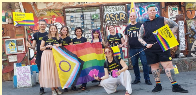
Ekipa slovenske Amnesty na Paradi ponosa v Ljubljani.

Na Paradi ponosa v Ljubljani smo začeli peticijo za pravico trans oseb v Sloveniji do samoopredelitve, ki jo je podprlo 18 slovenskih nevladnih organizacij . Namen peticije je doseči samoopredelitev, kar pomeni, da bodo lahko transspolne osebe same zase pred uradnim organom izrekle svojo spolno