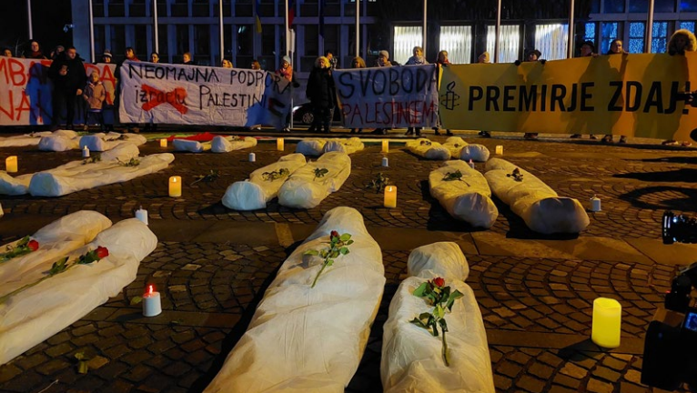
Protest za premirje 18. decembra 2023 v Ljubljani.

kršitvah humanitarnega prava. Na podlagi tega objavljamo številna podrobna poročila . Najpomembnejša lahko najdete tudi na našem spletnem mestu v slovenskem jeziku.