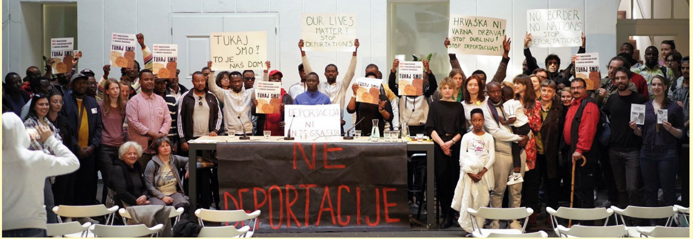
V Ljubljani je 4. maja potekala javna tribuna Kam Slovenija pošilja prosilce za azil? Na njej smo posvarili pred vračnanji po dublinski uredbi na Hrvaško.