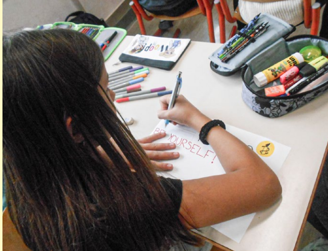
Pišem za pravice na OŠ Idrija.

Priprava čim bolj kakovostnih in raznolikih izobraževalnih gradiv nas vodi tudi pri projektu Učite se z Amnesty , ki smo