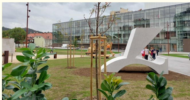
Obeležje v obliki črke Č v Parku izbrisanih.

Oktober je bil uresničen še en del prizadevanj za to, da se kaj takega ne ponovi, ko je bil v Ljubljani odprt Park izbrisanih in razkrito obeležje v obliki dela črke Č. S poimenovanjem parka se je ljubljanski mestni svet marca 2022 odzval na skupen poziv slovenske Amnesty in Civilne iniciative izbrisanih aktivistov Mestni občini Ljubljana, naj s poimenovanjem ulice ali kakega drugega javnega prostora obeleži spomin na to hudo