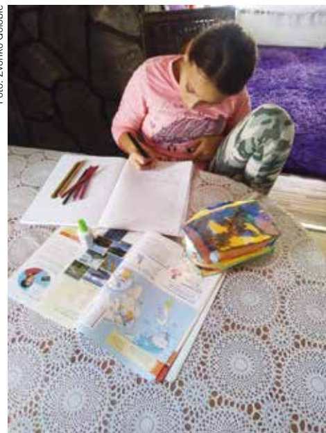
Hči Lilijane Tudi (pogovor z njo na naslednji strani) med pisanjem domače naloge.