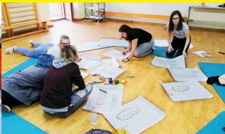
Aktivistične skupine mladih trenutno delujejo v Brežicah, Mariboru, Ljubljani, Piranu in Ajdovščini.