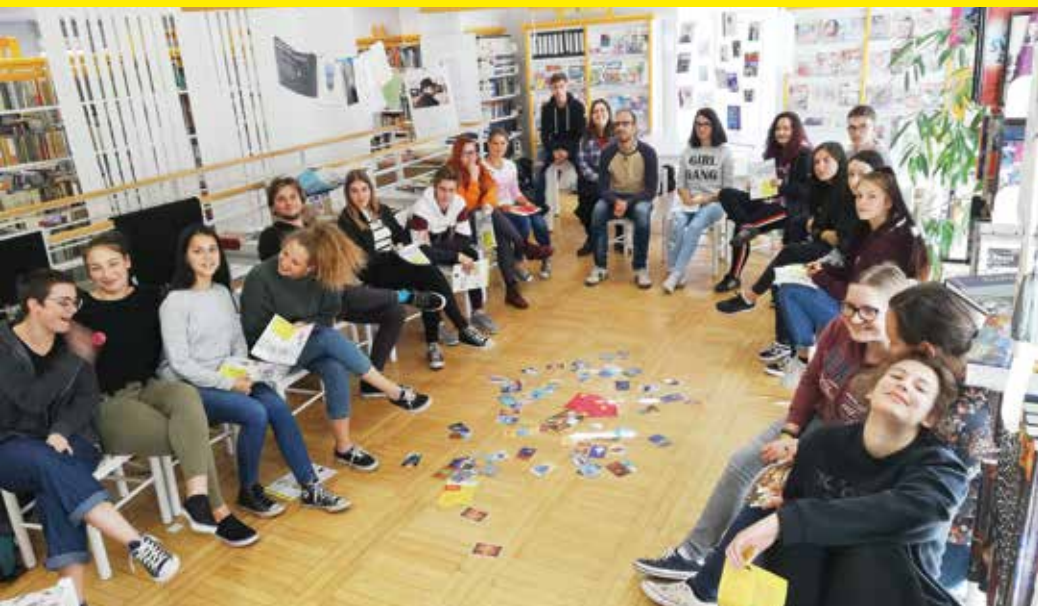
Največja aktivistična skupina je v Mariboru, na Srednji šoli za oblikovanje Maribor je aktivnih kar 22 mladih.

spoštovanje formalnih avtoritet. Ne pravim, da so to a priori negativne vrednote, gotovo pa niso edine, ki jih je treba razvijati. Demokratična in vključujoča družba potrebuje posameznike, ki so avtonomni, proaktivni, znajo izražati svoja stališča in interese, so večji angažiranosti v svoji skupnosti, predvsem pa se morajo zavedati, da imajo možnost vplivanja in sooblikovanja družbe, v kateri živijo. Takšne bodoče mlade državljane poskušamo opolnomočiti v mladinskih skupinah.