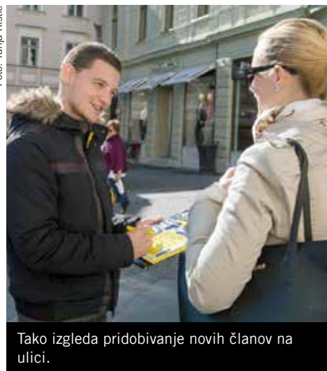
Tako izgleda pridobivanje novih članov na ulici.