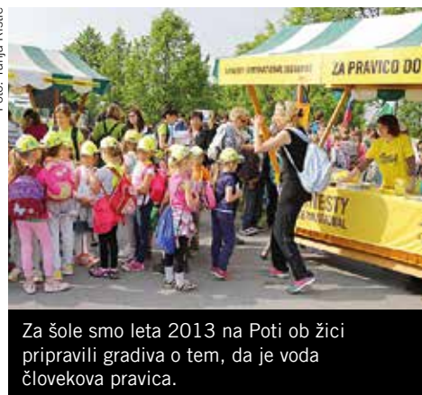
Za šole smo leta 2013 na Poti ob žici pripravili gradiva o tem, da je voda človekova pravica.