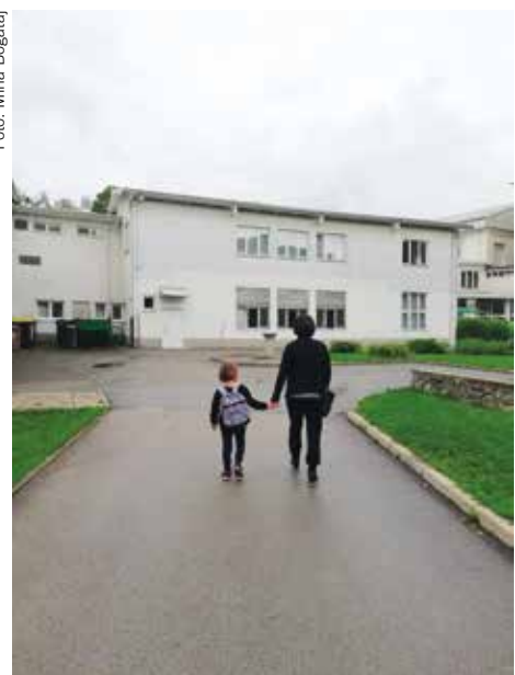
Prvi dan šole. (Slika je simbolna).