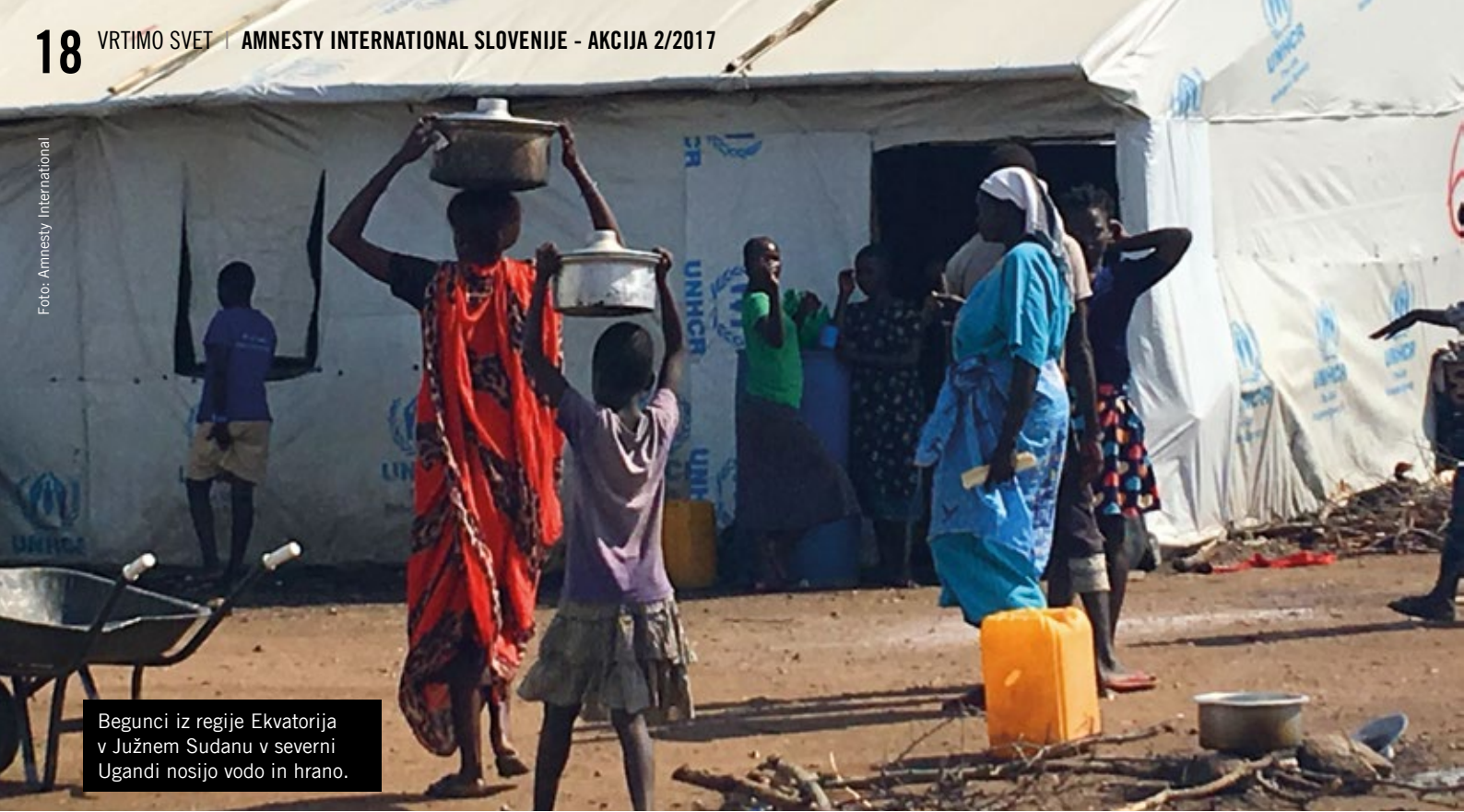
Begunci iz regije Ekvatorija v Južnem Sudanu v severni Ugandi nosijo vodo in hrano.