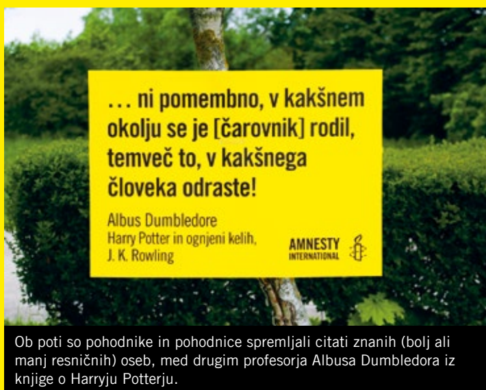
Ob poti so pohodnike in pohodnice spremljali citati znanih (bolj ali manj resničnih) oseb, med drugim profesorja Albusa Dumbledora iz knjige o Harryju Potterju.