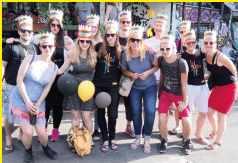
Ekipa Amnesty, »ozaljšana« z mavričnimi kronicami z napisom Ljubezen je človekova pravica.