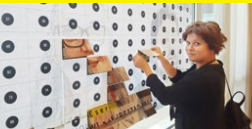
Iz podpisanih apelov za izpustitev v Turčiji zaprtih zagovornikov človekovih pravic smo na ICM ustvarili fotozid, ki ga je pripravila Amnesty Venezuela.

Sredi avgusta, v času priprave Akcije, je v Rimu potekalo Zasedanje mednarodnega sveta (znano po angleški kratici ICM). Poleg drugih odločitev je bila tam sprejeta reforma upravljanja našega gibanja; med drugim sprememba glasovalnih pravic sekcij, urnik srečevanja na najvišjih sestankih in s tem povezana posodobitev statuta. Vse izveste v naslednji (novembrski) Akciji, že zdaj pa najdete informacije na www.amnesty.si/ICM17 .