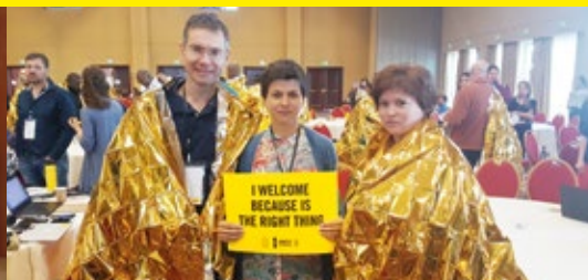
Udeleženci_ke smo se pridružili tudi fotopeticiji za reševanje življenj beguncev_k, ki umirajo med prečkanjem Sredozemlja. Več na straneh 10 in 11; peticija pa v rubriki Pisma rešujejo življenja.