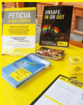
Na sklepnem prizorišču Parade ponosa smo zbirali podpise pod peticijo za zaščito gejev v Čečeniji.

morajo geji svojo identiteto skrivati celo pred družino in prijatelji. Še vedno namreč prihaja do »umorov zaradi časti«, ko gre za domnevno omadeževano čast družine, kamor sodijo tudi istospolno usmerjeni odnosi.