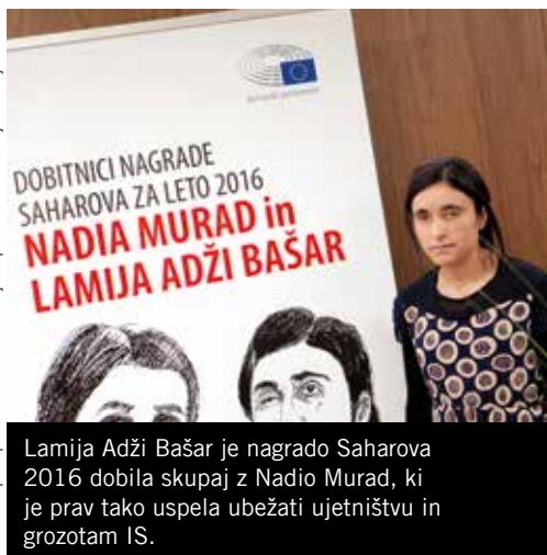
Lamija Adži Bašar je nagrado Saharova 2016 dobila skupaj z Nadio Murad, ki je prav tako uspela ubežati ujetništvu in grozotam IS.