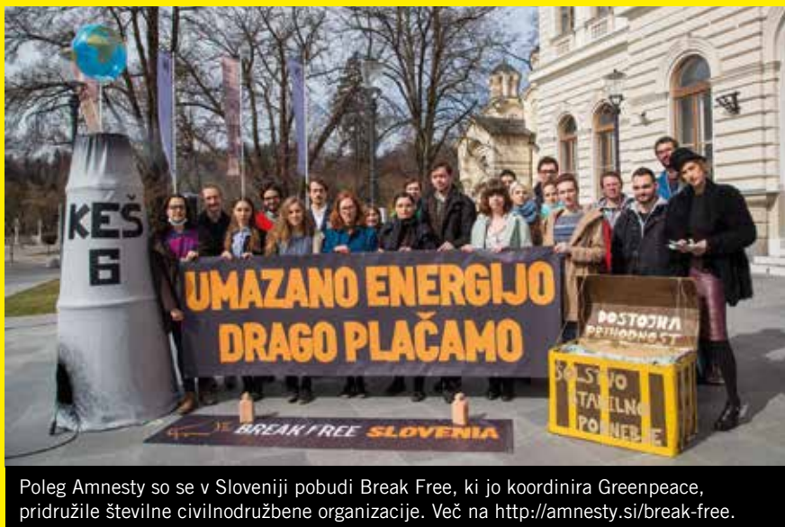
Poleg Amnesty so se v Sloveniji pobudi Break Free, ki jo koordinira Greenpeace, pridružile številne civilnodružbene organizacije. Več na http://amnesty.si/break-free .

Obveznosti varovanja človekovih pravic pred posledicami onesnaženja okolja so priznala sodišča in mednarodne organizacije za spremljanje stanja na področju človekovih pravic z vsega sveta. Države morajo tako na nacionalni ravni