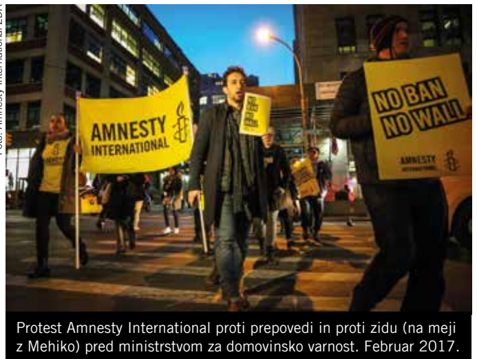
Protest Amnesty International proti prepovedi in proti zidu (na meji z Mehiko) pred ministrstvom za domovinsko varnost. Februar 2017.

Njegovi poskusi, da bi prikrikl ksenofobni namen prepovedi, niso preslepili sodnikov na zveznem okrožnem in prizivnem sodišču, ki so presodili, da je njegovo upravičevanje z nacionalno varnostjo neprepričljivo.