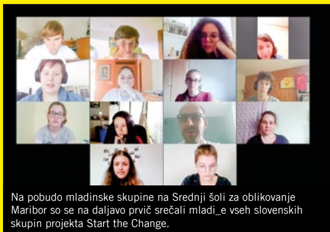
Na pobudo mladinske skupine na Srednji šoli za oblikovanje Maribor so se na daljavo prvič srečali mladi_e vseh slovenskih skupin projekta Start the Change.

Prva akcija z naslovom Start the Change UNITED je bila izvedena na pobudo mladinske skupine na Srednji šoli za oblikovanje Maribor. Mladi vseh slovenskih mladinskih aktivističnih skupin tega projekta so se srečali na daljavo. Razmišljali so o pomenu aktivizma in proaktivnosti med mladimi ter kaj trajnostnega lahko naredijo skupaj v svojih lokalnih okoljih. Drugo akcijo je pripravila mladinska skupina projekta iz Srednje šole Veno Pilon Ajdovščina (sosednji prispevek na tej strani).