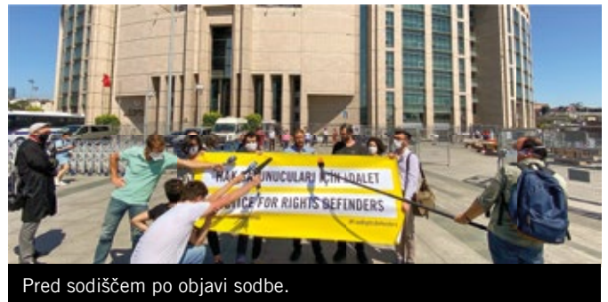
Pred sodiščem po objavi sodbe.

Na celotnem poteku sojenja so bile obtožbe »terorizma« proti 11 obtoženim vedno znova in kategorično dokazane za