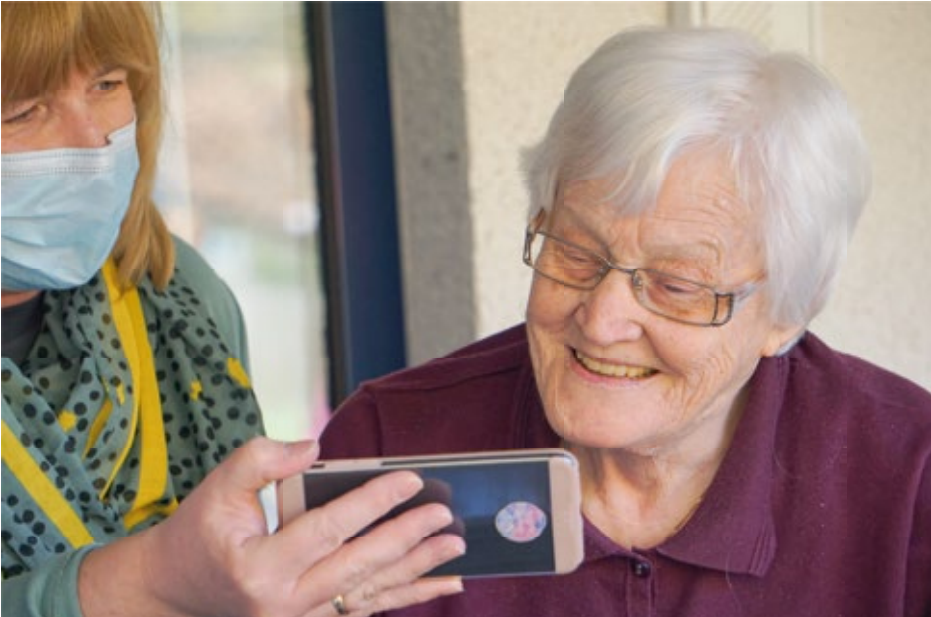
Fotografija je simbolna.