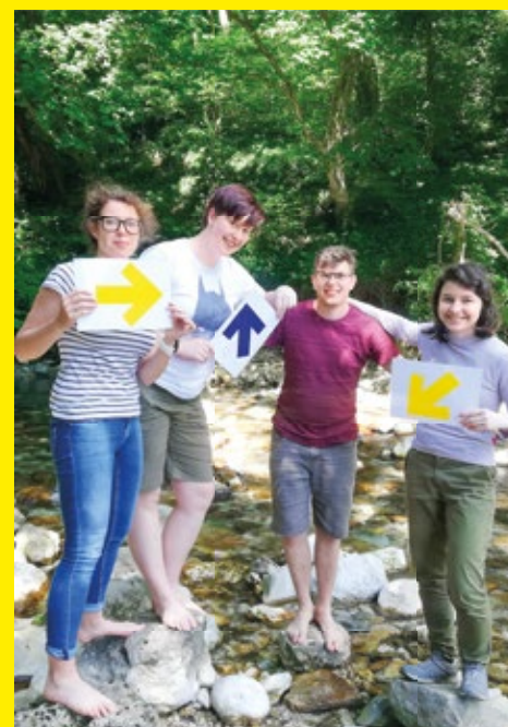
Mladinska aktivistična skupina na SŠ Veno Pilon Ajdovščina v akciji.

Snemanje in priprava gradiva sta potekala v naravi. Sproščeno vzdušje, mnogotere ideje o tem, kako posneti posamezen kader, super pripravljenost mladih na snemanje in kreativnost so prispevali k temu, da je nastalo odlično gradivo za video.