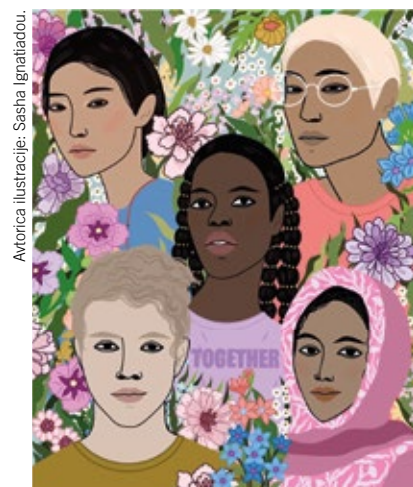
Avtorica ilustracije: Sasha Ignatiadou.

Amnesty International se je med pandemijo covid-19 povezala z ilustratorji, ki so ustvarili ilustracije o tem, kako je kriza izostrila vprašanja človekovih pravic. Ilustratorica Sasha Ignatiadou je tako upodobila slogan »Skupaj«.