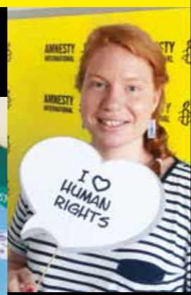
Petra, dobrodošla nazaj!

Na junijski paradi ponosa v Ljubljani smo razveselili številne, ki smo jim podarili našo »kronico«.