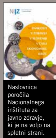
Naslovnica poročila Nacionalnega inštituta za javno zdravje, ki je na voljo na spletni strani.